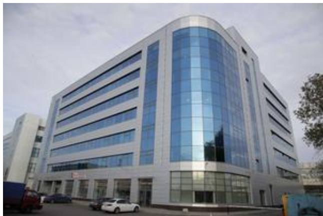
L'immeuble de Saint-Petersbourg qui abriterait l'IRA, une armée de hackers russes.

emploie un millier de cyberactivistes. Ceux-ci surveillent le web, répandent des fausses nouvelles, dénigrent les opposants à Poutine et créent de faux comptes sur les réseaux sociaux. L'IRA est l'une des plus importantes «usines à trolls» liées au Kremlin. ( http://www.lefigaro.fr/secteur/high-tech/2017/10/11/32001-20171011ARTFIG00271-google-facebook-et-twitter-dans-la-tourmente-de-l-enquete-russe.php ) Selon une étude récente de la société de cybersécurité New Knowledge, l'IRA est monté en puissance de manière exceptionnelle, réussissant à toucher 126 millions d'utilisateurs sur Facebook, au moins 20 millions sur Instagram et 1,4 million sur Twitter. «Nous n'avons pas de détails sur les liens entre l'IRA et les services russes, mais la chronologie de leurs interventions peut laisser penser qu'ils coordonnent leurs opérations, que ce soit sur l'Ukraine, la Syrie ou d'autres pays», avance Camille François, chercheuse associée à Harvard et directrice de l'innovation chez Graphika, une société américaine d'analyse des données qui a cosigné fin 2018 un rapport pour le Sénat américain sur l'IRA.