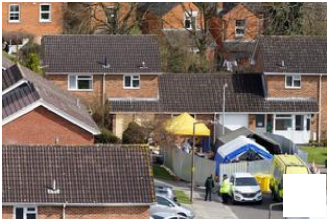
La maison de l'agent double Sergueï Skripal, à Salisbury, en Angleterre.

Bienvenue dans la nouvelle guerre froide! Elle ne relève pas du fantasme: le 4 mars 2018, Sergueï Skripal, ancien officier du renseignement militaire russe (GRU) et agent double, expulsé de Moscou vers Londres en 2010, a fait l'objet, avec sa fille, d'une tentative d'empoisonnement à son domicile de Salisbury, en Angleterre.