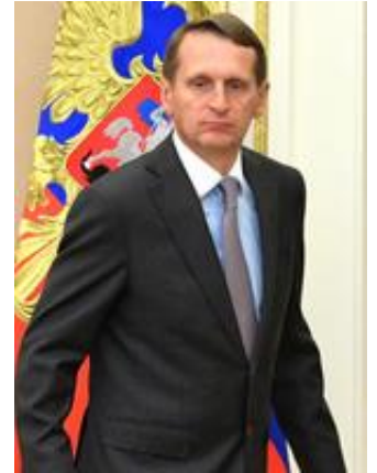
Le chef des services de renseignement extérieur russes (SVR), Sergueï Narychkine.