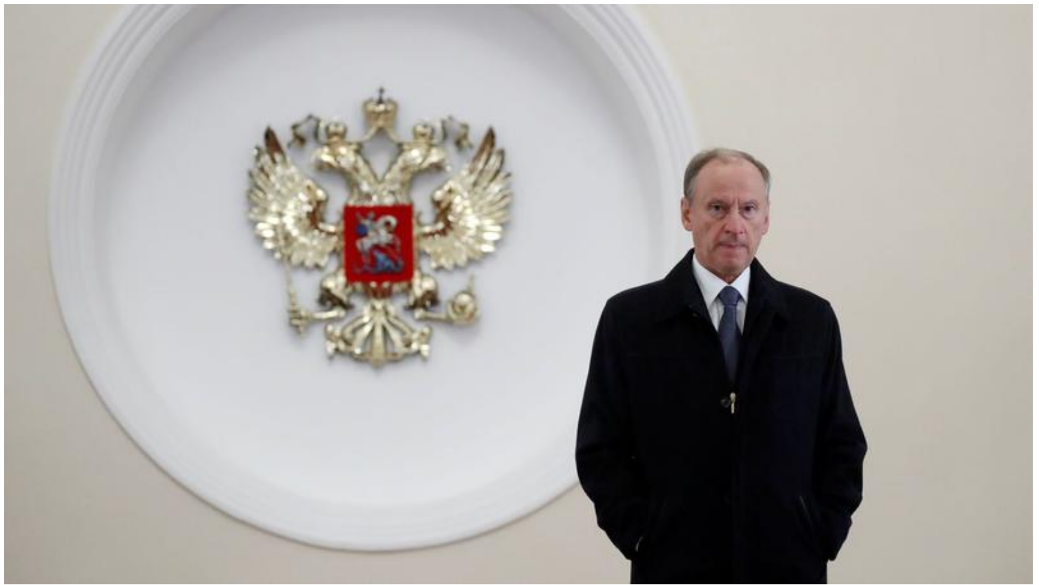
Le directeur du Conseil de sécurité russe, Nikolai Patrouchev.