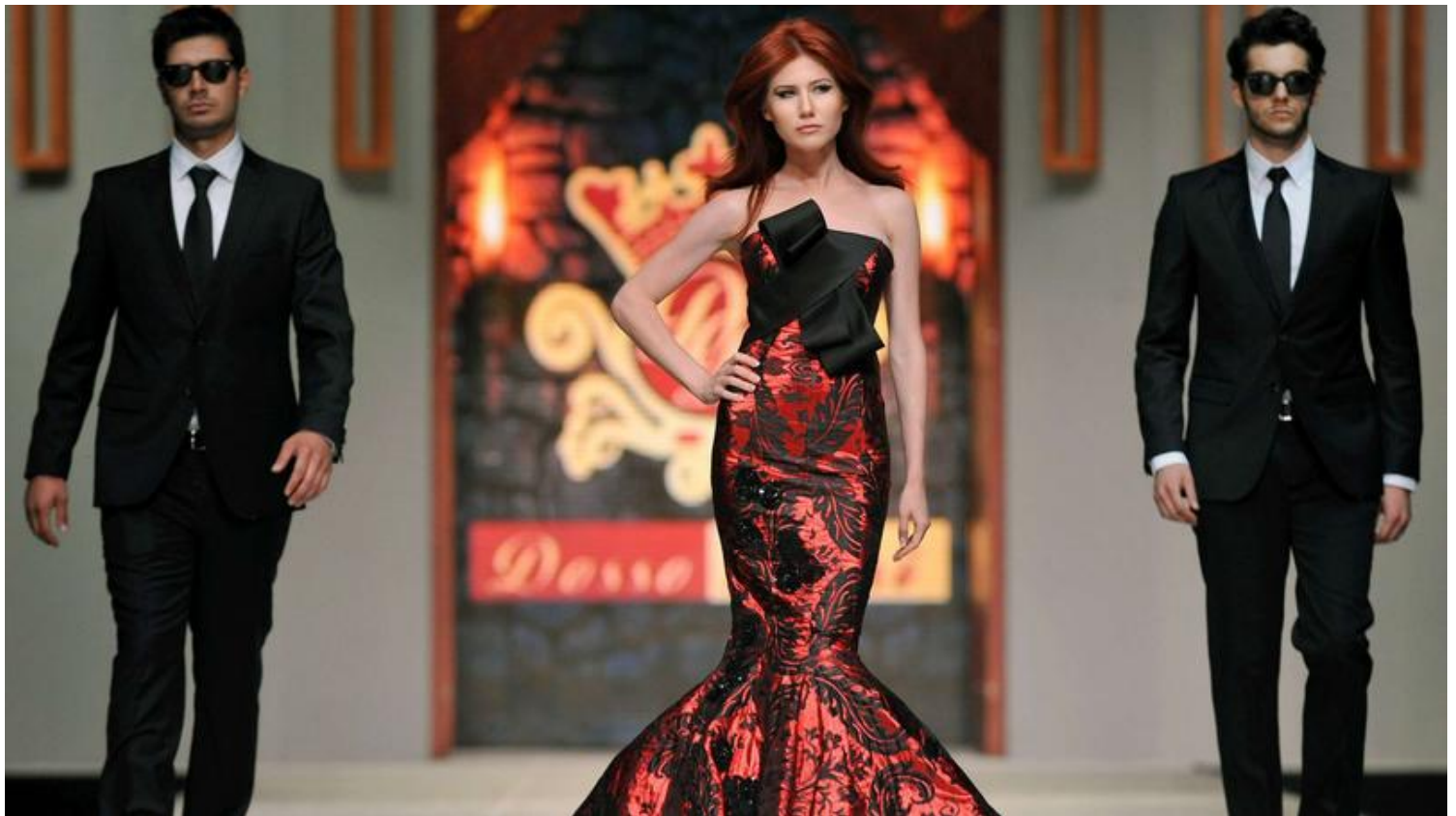
2012. L'ex-agent dormant russe Anna Chapman expulsée d'Amérique joue au mannequin en Turquie.

«Comparé à ce qui se passe aujourd'hui, la guerre froide du XX e siècle, c'était des enfants jouant dans un bac à sable!» Cette phrase n'a rien d'anodin. Elle a été prononcée l'an dernier par Anna Chapman, jeune Russe de 37 ans, experte en matière d'espionnage ( http://www.lefigaro.fr/international/2014/01/31/01003-20140131ARTFIG00138-anna-chapman-une-espionne-si-sexy.php ). Fille d'un cadre du KGB, les services secrets de l'ère soviétique, Anna, née Kouchtchenko, a œuvré au Royaume-Uni où elle a épousé un homme d'affaires nommé Chapman, puis aux États-Unis, pour le compte du Service de renseignement extérieur de la Fédération de Russie (SVR). Arrêtée à New York par le FBI en juin 2010 avec neuf autres espions, elle a été échangée contre quatre Russes accusés d'espionnage pour les Américains. Décorée à son retour à Moscou, devenue star de la télévision et top-modèle, Anna Chapman continue de vanter les mérites de Vladimir Poutine qui défend, selon elle, son pays contre ses «ennemis» occidentaux: «Il ne sera plus possible de défier la Russie sans en subir les conséquences», a lancé, il y a quelques mois, la Mata Hari aux yeux verts.