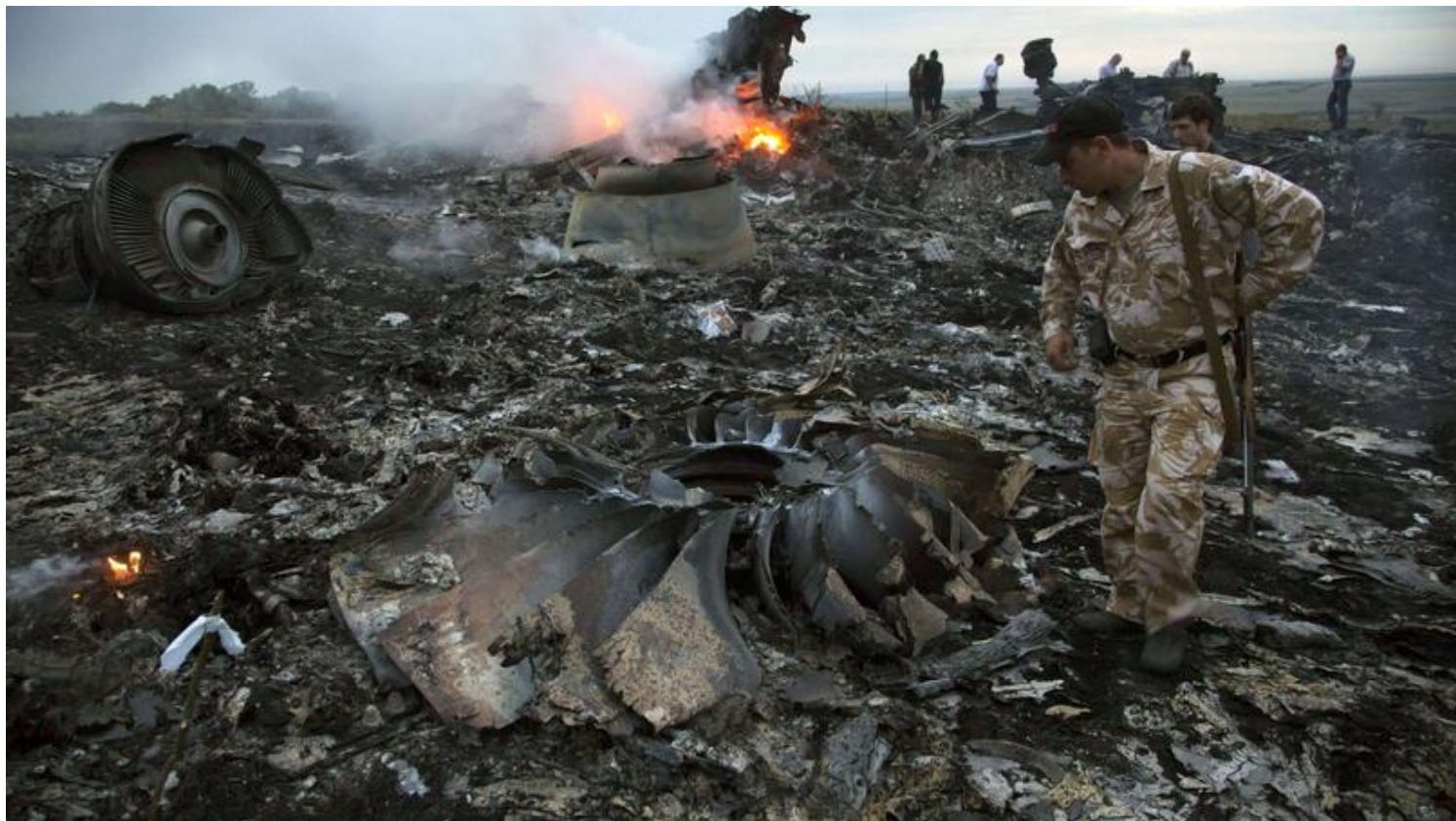
Les restes de l'avion de la Malaysia Airlines abattu en Ukraine par un missile russe en juillet 2014.

Lorsque l'avion de la Malaysia Airlines est abattu au-dessus de la région du Donetsk ( http://www.lefigaro.fr/international/2014/07/21/01003-20140721ARTFIG00330-crash-du-vol-mh17-kiev-et-les-separatistes-prorusses-continuent-de-s-accuser-mutuellement.php ), le 17 juillet 2014, les soupçons occidentaux s'orientent vers un tir de missile russe - ce que confirmera, en 2018, l'équipe de l'enquête internationale, spécialement formée aux Pays-Bas. Moscou nie toute implication. Le 19 juin 2019, les enquêteurs citeront à comparaître un Ukrainien et trois agents russes - un du FSB et deux du GRU -, suspectés d'avoir joué un rôle dans cet attentat. Coïncidence: durant les trois jours suivant le crash du vol MH17, Twitter a connu un pic d'activité provenant d'une mystérieuse entité russe, laquelle a inondé les réseaux sociaux de 111.000 tweets destinés à écarter la responsabilité de Moscou.