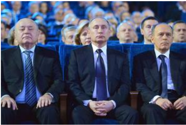
Entourant leur président, deux hommes clés de la sécurité russe: Mikhaïl Fradkov et Alexandre Bortnikov.