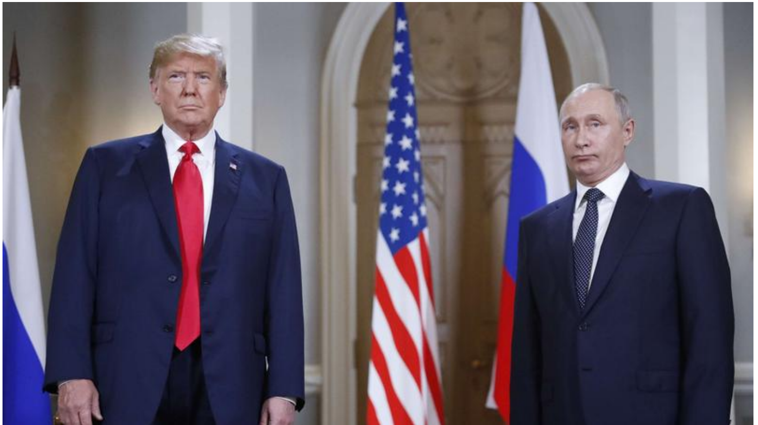
Donald Trump a-t-il bénéficié de l'aide des hackers du Kremlin pour être élu?

( http://www.lefigaro.fr/flash-actu/2018/10/19/97001-20181019FILWWW00373-une-russe-inculpee-aux-etats-unis-pour-avoir-tente-d-influer-sur-les-elections-de-mi-mandat.php ), d'un coût de plus de 35 millions de dollars. Dès 2013, des faux comptes américains sont créés en masse par l'IRA afin de glaner de l'audience dans tous les milieux. Certains se font passer pour des activistes noirs ou des promusulmans, d'autres pour des conspirationnistes, des partisans du port d'armes, des opposants à l'immigration ou des supporters de Trump. «Les trolls de l'IRA ont gagné énormément d'influence, au point d'être connectés sur Facebook à plus de 30 millions de personnes aux États-Unis entre 2015 et 2017», révèle Camille François.